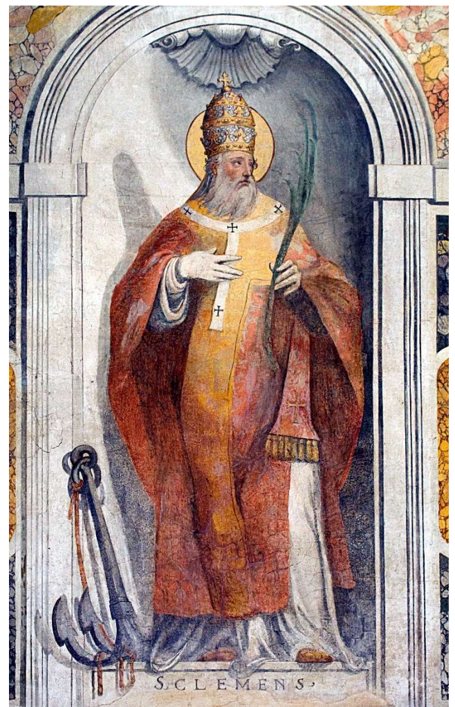
Fresque XVI e siècle représentant le pape Saint Clément Ier, revêtu d'une robe papale, se trouvant dans la basilique Saints-Nérée-et-Achille à Rome.