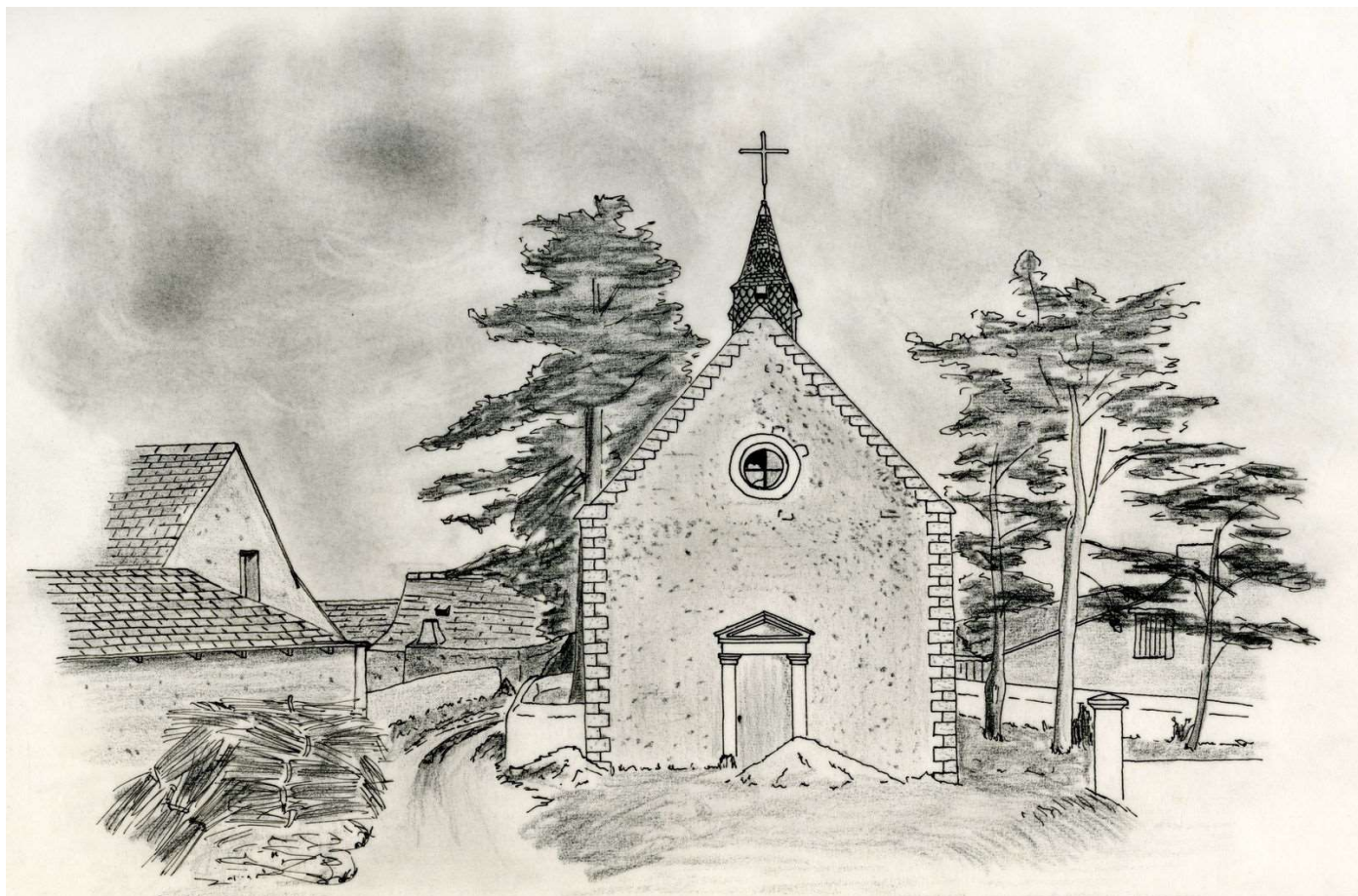
Chapelle Saint Clément de l'Alleud d'après une carte postale (Dessin Pascal Jouy - 1984)

Cette chapelle, dont la fondation nous est inconnue, était dédiée à Saint-Clément et Saint-Joyeux, patrons des marins, témoignant ainsi de l'importance qu'occupait à l'époque la navigation dans ce village de l'Alleud, avant que ne fut construite la levée. Et il ne faut pas oublier qu'au siècle dernier l'Alleud était un endroit très réputé pour ses pêcheries.