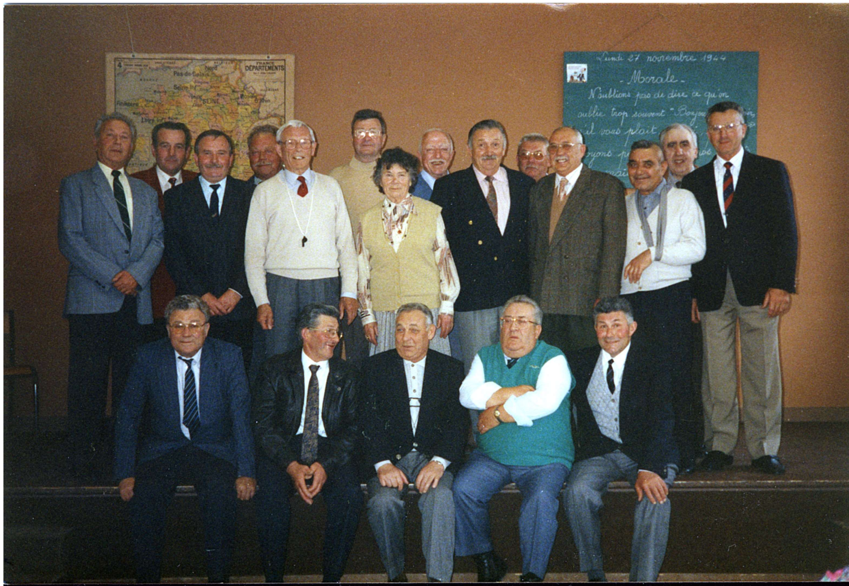
D'anciens élèves de Lucien Radigois, le 24 mars 1993