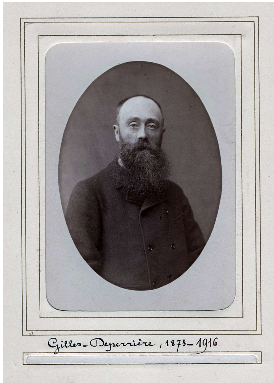
Portrait de l'architecte Émile Gilles-Deperrière.

Recueil de photographies d'architectes admis à la Société Centrale entre 1869 et 1874.